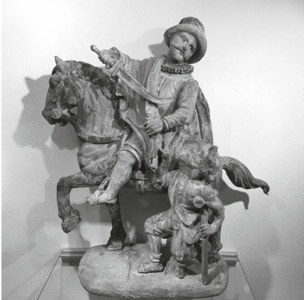
Heiliger Martin, Patron unserer Pfarrei